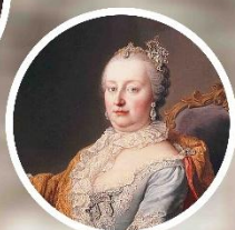
cisarovna Maria Terezia