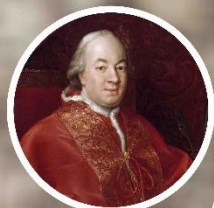
papež Pius VI.