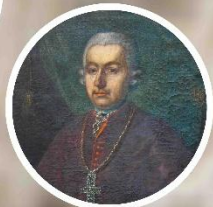
prvý banskobystrický biskup František Berchtold

Deo gratias! P.S. ☺ A.D. 2 0 2 6 S.F.X.O.P.N.