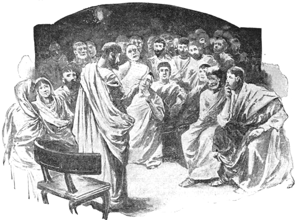
READING THE EPISTLE TO THE ROMANS TO THE EARLY CHRISTIANS AT ROME.— Rom. i.

ľudu. Po smrti apoštolov sa ustálila organizácia kňazských služieb v trojstupňovej hierarchii: biskup, pastier a predseda spoločenstva, obklopený presbytermi, ktorému pomáhajú diakoni. Ale o tom až nabudúce.