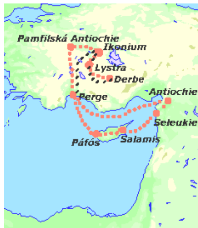
Mapa východného Stredomoria s vyobrazením Pavlovej 1. cesty

Prví kresťania prišli do Antiochie v čase prvých prenasledovaní: Tí, čo sa rozprchli pred súžením, ktoré nastalo za Štefana, došli až do Fenície, na Cyprus a do Antiochie, ale nikomu neohlasovali slovo, iba Židom (Sk 11, 19). Prvým organizátorom komunity v Antiochii s poverením od cirkvi v Jeruzaleme bol Barnabáš (por. Sk 11, 22), ktorý vyhľadal Pavla a zobral ho za svojho spolupracovníka. Práve títo dvaja dostávajú neskôr od komunity a Ducha Svätého nové poslanie. Položenie rúk, ako svedčí text v Sk 13, 2-3 počas liturgie, neznamená vysviacku, ale skôr požehnanie pred dôležitým poslaním. Z Antiochie odchádzajú do Seleucie, ktorá bola prístavným mestom Antiochie. Prístav Seleucia sa nachádza asi 10 km od Antiochie. Bol dôležitým vojenským a obchodným prístavom pri ústí rieky Orontes. Seleucia sa pôvodne nazývala Paleopolis, čo v preklade znamená Staré mesto . Mesto založil Seleucid I.-Nikator okolo r. 310 pred Kristom. Z tohto prístavu Barnabáš a Pavol vyplávali smerom na Cyprus v spoločnosti Jána Marka.